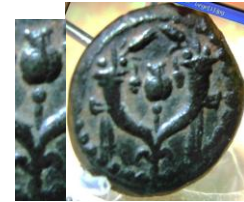
רימון מסוגנן על מוט בתחתיתו גולה. 2

טביעה נוספת של מטבעות של אלכסנדר ינאי היא הקבוצה המוגדרת ע"י המחבר כמטבעות "כונהיות". אופייני למטבעות אלה שעל פני המטבעות כתובת בעברית עתיקה "יהונתן כהן גדול וחבר היהודים". על צדה האחר של המטבע מופיעים קרני שפע בתוכם רימון מסוגנן הניצב על מוט, סמל הכהן הגדול. על חלק מטיפוסי מטבעות החשמונאים בכלל, הנושאים דגם זה, שטבעו השליטים יוחנן הורקנוס הראשון ויהודה אריסטובולוס הראשון מוצג, בתחתית המוט עליו ניצב הרימון גולה. על מטבע המרד הגדול נגד הרומאים דומה הגולה החשמונאית לגולה המוצגת מתחת למטה עם 3 הרימונים שמסמל את מטה הכהן הגדול.