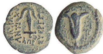
מטבע משותפת של יוחנן הורקנוס ה-I ואנטיוכוס השביעי

במקביל טבע אלכסנדר מטבעות בעריך חצי פרוטה בהם על פני המטבע מוצג כף תמר עם הכתובת מסביבה "יהונתן המלך" בעברית עתיקה ועל צדה השני של המטבע דגם השושן. דגם השושן מופיע על חלק ממטבעות "יהד" מהתקופה הפרסית. דגם השושן מופיע גם על מטבע שטבע אביו יוחנן הורקנוס הראשון עם אנטיוכוס השביעי. דגם דומה של חצי פרוטה טבע אביו על צדה השני כף תמר עם הכתובת "יוחנן כהן גדול וחבר היהודים". השושן שימש סמל ממלכתי ביהודה. מטבע "מלכותית" נוספת ומאוחרת שטבע אלכסנדר ינאי היא מטבע דו לשוני המציגה על פניה את דגם העוגן עם הכתובת ביוונית "המלך אלכסנדרוס" ועל גבה כוכב בן 8 קרניים בתוך נזר מלכותי והכתובת בעברית עתיקה בתוך הכוכב "יהונתן המלך". הכתובת מכילה 10 אותיות ובין הקרניים 8 מרווחים בהם ניתן לכלול 8 אותיות לפיכך מופיעים בכוכב 2 צמדי אותיות. הכתובות במטבעות הדו לשוניות בכתובת בעברית נועדה לאוכלוסייה היהודית והכתובת ביוונית נועדה לאוכלוסייה הנכרית באזורים שכבש אלכסנדר ינאי, בהם האוכלוסייה ההלניסטית הייתה דוברת וקוראת השפה היוונית.