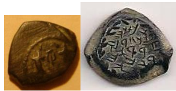
מטבע ינאי עם הכתובת "ינתן כהן גדול וחבר היהודים"