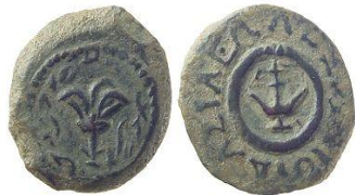
מטבע "מלכותית" של אלכסנדר ינאי

המחבר פלח את רוב מטבעות אלכסנדר ינאי ל-2 סוגים עיקריים: מטבעות "מלכותיים" ומטבעות "כונהניים". את המטבעות המוגדרים כמטבעות "מלכותיים" שהם דו לשוניים ברובם, מאפיינים הכתובת בעברית עתיקה "יהונתן המלך" על פני המטבע עם דגם השושן. על צדה השני של המטבע מוצג סמל העוגן, עם הכתובת ביוונית "של המלך אנטיוכוס השביעי". סמל העוגן נטבע על ידי אביו, יוחנן הורקנוס הראשון על מטבע משותפת עם אנטיוכוס השביעי סידטס.