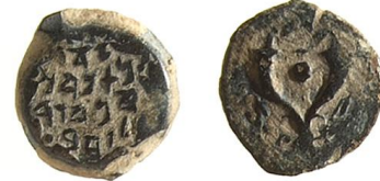
מטבע "כונהית" של אלכסנדר ינאי עם הכתובת "יהונתן כהן גדול וחבר היהודים"