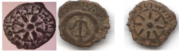
מטבע ברונזה עם הכתובת בארמית "מלכא אלכסנדרוס שנת 25" וכתובת ביוונית "המלך אלכסנדר"

טביעה נוספת של אלכסנדר ינאי היא מטבע דו לשוניות בארמית וביוונית על פניה כתובת ביוונית הכוללת עוגן בתוך חישוק עם הכתובת המלכותית "אלכסנדר המלך שנת 25". על צדה השני של המטבע מוצג הכוכב המלכותי. סביב הכוכב מופיעה הכתובת בארמית "מלכא אלכסנדרוס שנת 25", היינו שנת 79/8 למלכותו של ינאי. שנת 25 היא חצי יובל ולא ברור במחקר משמעות מונח זה. מטבע זו אינה נושאת את השם "יהונתן".