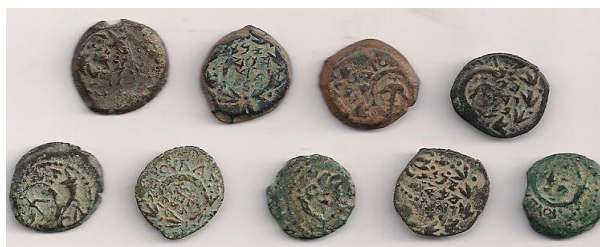
דוגמאות לטביעת הישבון

מטביעת ההישבון אנו למדים שהטביעה המקורית הכוללת שושן עם הכתובת בעברית "יהונתן המלך" ועוגן עם כתובת ביוונית "המלך אלכסנדרוס", קדמה לרושמה עם קרני שפע ורימון על מוט ביניהם וכתובת בעברית עתיקה "ינתן כהן גדול וחבר היהודים". לפיכך מטבעות אלה עם טביעת שושן ועוגן מלכותי למעשה נטבעו תחילה ובתהליך ההישבון נטבעו מטבעות הישבון עם הרושמה של קרני שפע וכתובת בעברית עתיקה. נמצאו מספר מועט של מטבעות המציגות כוכב בתוך נזר מלכותי עם כתובת בעברית "יהונתן המלך" ועוגן מלכותי עם כתובת ביוונית "המלך אלכסנדרוס", על המטבע מטיפוס קרני שפע וכתובת בעברית עתיקה. טביעת הישבון מעידה שמטבעות עם טביעת קרני שפע/כתובת בעברית עתיקה קדמו לטביעת מטבעות כוכב/עוגן.