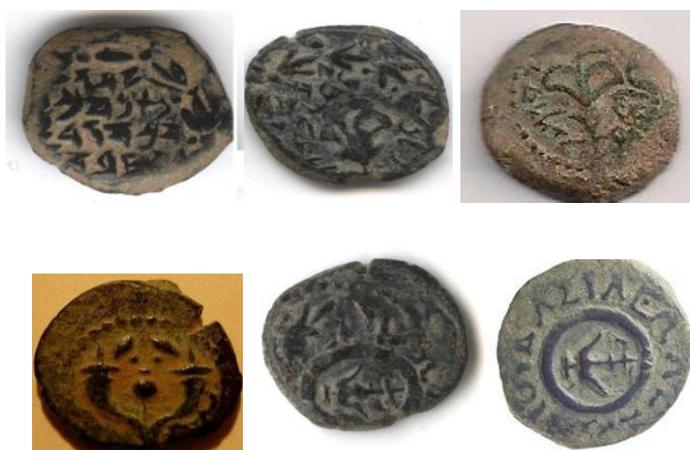
טביעת הישבון ודוגמת המטבעות הטבעות במטבע הישבון

טביעת מטבעות כוכב/עוגן נעשתה במקביל לטביעת מטבעות קרני שפע/כתובת בעברית ותפוקת המטבעות עם טביעת כוכב בתוך נזר מלכותי עם הכתובת הנזכרת גברה לאין שיעור בהמשך ועל כך מעידים נתוני סקר שערך המחבר והמכיל נתונים על ממצא מטבעות אלכסנדר ינאי במכלול 10 חפירות ארכיאולוגיות שנערכו בארץ. המחבר מסיק מהממצאים שמלאי המטבעות עם דגם השושן והכתובת "יהונתן המלך" שבצדה השני דגם העוגן עם הכתובת "המלך אלכסנדרוס", שהיו במחזור נאספו ברובם לקראת תהליך ביצוע ההישבון. לאחר סיום תהליך זה לא המשיכו לטבוע מטבעות אלה ובמחזור נותרו יחסית ליתר מטבעות אלכסנדר ינאי מעט מטבעות מדגם זה. נתון זה מאומת על פי סקר ממצאי מטבעות ינאי מ-10 החפירות שיובא בהמשך.