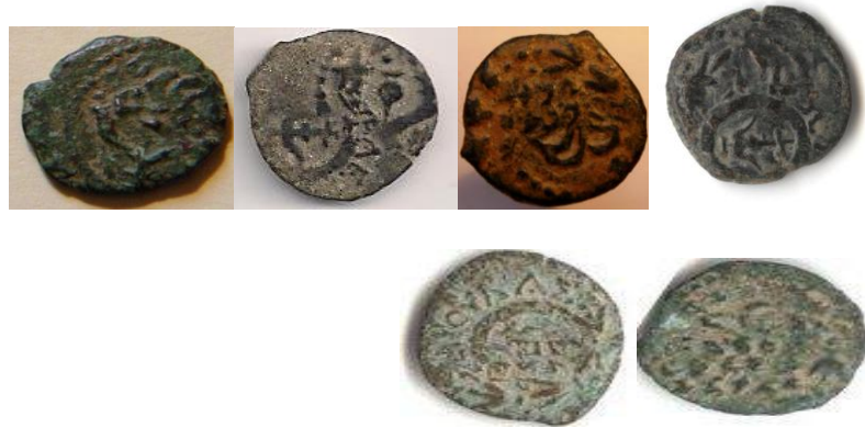
דוגמאות ממטבעות הישבון בהן נראית בבירור הטביעה הקודמת בצד טביעת הישבון

מבדיקת הטביעה על רוב מטבעות ההישבון ניתן להניח שהטביעה ה"כונהנית" שנעשה מעל הטביעה המלכותית לא נועדה לטשטש או למחוק את הטביעה הקודמת אלא לשלב באופן שתוצג על המטבעות טביעה נוספת כך שעל המטבעות ניתן לראות הן הטביעה ה"מלכותית" והן טביעה "כונהנית" ו"חבר היהודים". אילו רצה ינאי בטביעות ההישבון לבטל או למחוק הטביעה הקודמת יכול היה למשל לפעול במתכונת הטכנית שפעל בר כוכבא על מטבעותיו מברונזה באמצעות הנחייה לשייף בפצירה את פני המטבע או לחילופין להשתמש בפטיש בכדי למחוק הטביעה הקודמת. העובדה שאלכסנדר ינאי לא עשה כן כפי שהעובדה נראית בבירור על רבים ממטבעות ההישבון שטבע, מעידה על כוונותיו. על פי מה שניתן להבחין על חלק גדול מהמטבעות ניתן להניח שתופעת טביעת ההישבון באה לשלב את 2 הטביעות יחד לפי מספר דוגמאות של מטבעות המופיעות מטה.