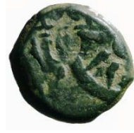
מטבע כוכב בתוך נזר מלכותי עם הכתובת "יהונתן המלך"