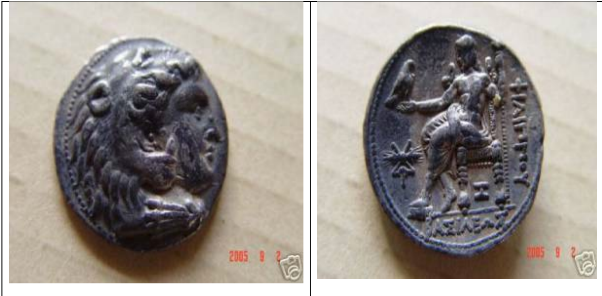
מטבע של פיליפוס III, כתובת מלכותית מתחת לכס, ברק ומונוגרמה משמאל, I מתחת לכס (323–316 לפסה"נ).

ישנן שתי קבוצות של מטבעות שנמצאו במסופטמיה: סטטר עם האריה וטטדרכמות עם הסמל של עוגן, שיש חילוקי דעות לגבי מוצאם. רוב החוקרים סבורים שהמטבעות שייכים למטבעה של שושן (למרות הדמיון למטבעות ארדוס). יתכן שהיה מעבר של מטבעות מפיניקה למסופטמיה בעקבות מסע שערך סלווקוס הראשון למצרים. המטבעות מתוארכים לשנים 317–330. הכוונה למטבעות ארדוס בעלי המספר הקטלוגי פרייס A 3357–3356 הדומים בסגנון למטבעות שושן: פרייס 3842–3841. מטבעות עם אותיות פיניקיות: פרייס 3303–3306.