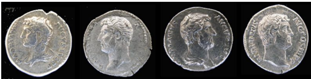
ראש לא מעוטר לשמאל עם גלימה ראש לא מעוטר לשמאל ראש לא מעוטר לימין עם גלימה ראש לא מעוטר לימין