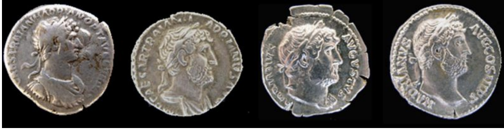
ראש מעוטר לימין עם שריון וגלימה ראש מעוטר לימין עם גלימה ראש מעוטר לימין קישוט על כתף שמאל ראש מעוטר לימין